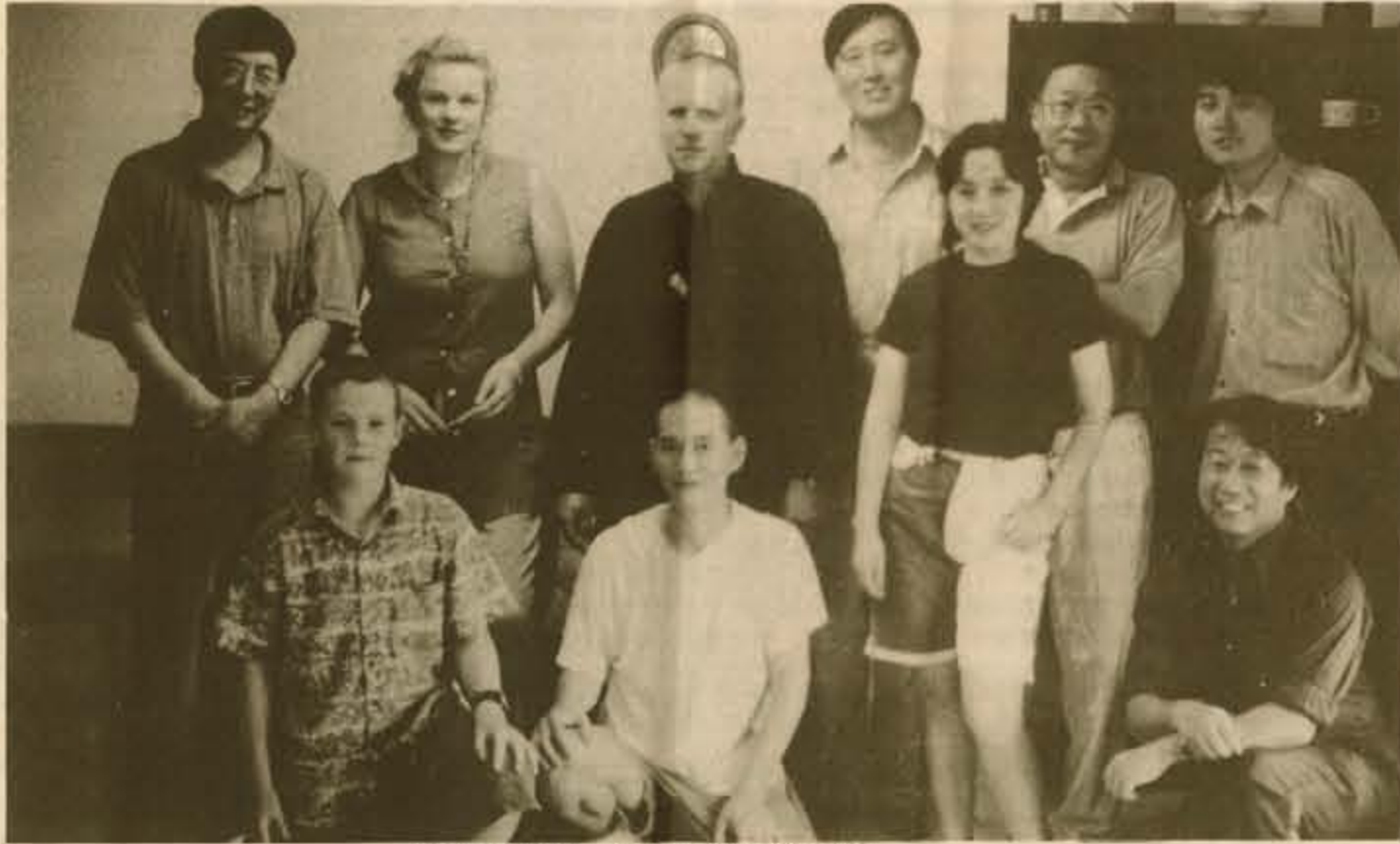
「遠離中國」畫展:華人畫家向主流社會亮相

前者第一類是中國畫家在「世界大串聯」中創造的專利行業。它的群像運動式的壯觀令西方人看到嘆為觀止的東洋景。無論美加,還是法國等歐洲各國,